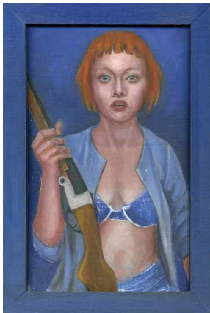
FARHAD MOSHIRI Cowboy and Indian | 2007 | Acrylique et paillettes sur toile | Courtesy The Farjam Collection | © Farhad Moshiri | Photo André Morin