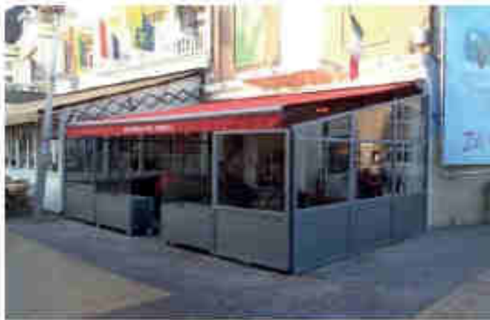
Paravent avec soubassement plein