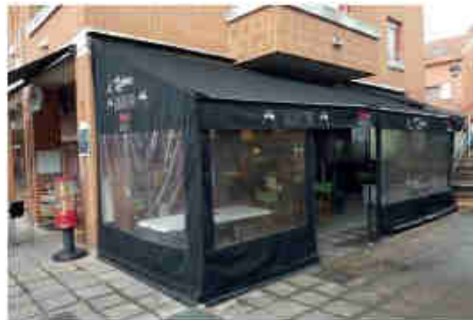
Les abris bâchés pour terrasse