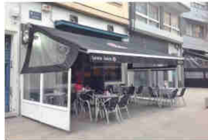
Le désordre apparent