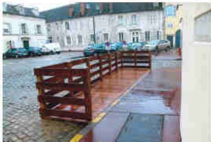
Barrières et platelages bois