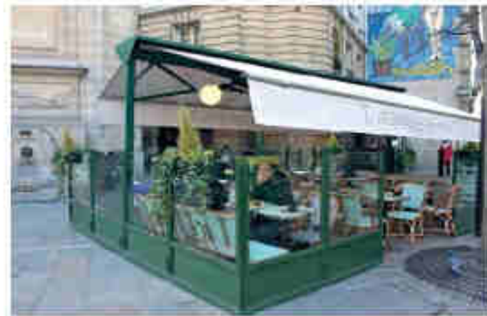
Soubassements et types de stores