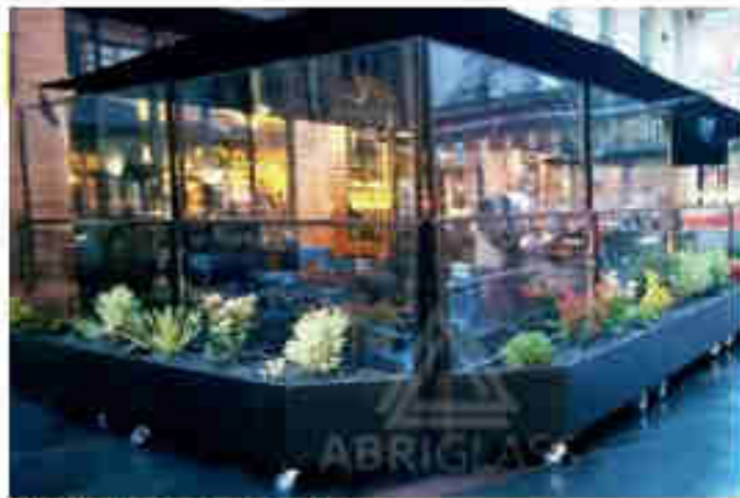
Jardinières en façade