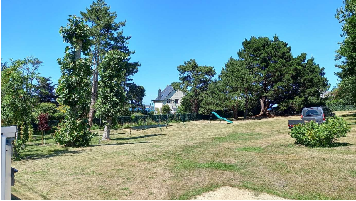
Cône de vue n°3 – Chemin des Houles