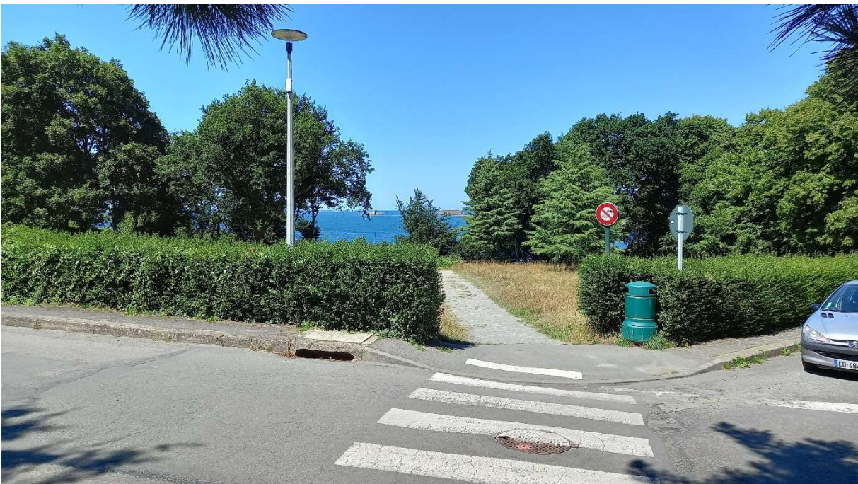
Cône de vue n°10 – Place du Père Yvon (En direction de Port Siboulière)