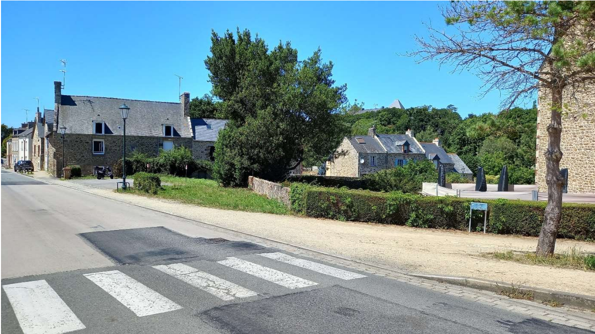
Cône de vue n°9 – Avenue Albert Caquot (Alignement de maisons de la Basse Guais)