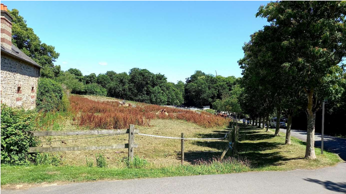
Cône de vue n°6 – Avenue de la Libération (la perspective visuelle sur le manoir de Port Breton a été bouchée par la croissance des arbres)