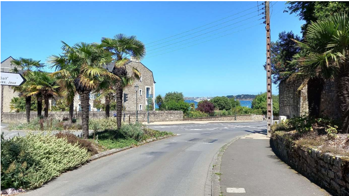
Cône de vue n°4 – Carrefour boulevard de la Libération - Avenue de la Vicomté