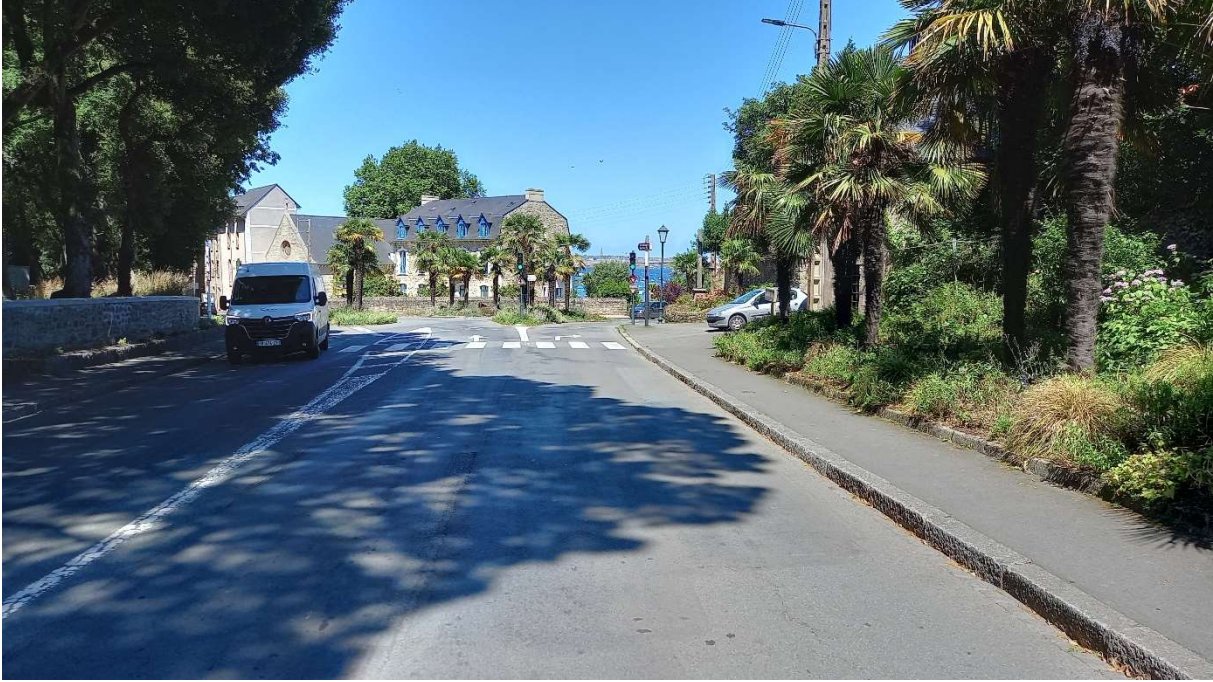
Cône de vue n°5 Boulevard de la Libération