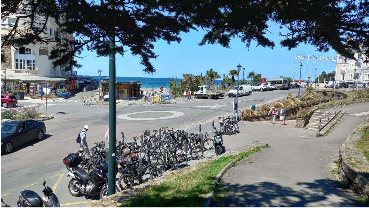
Cône de vue n°11 – Place Verney