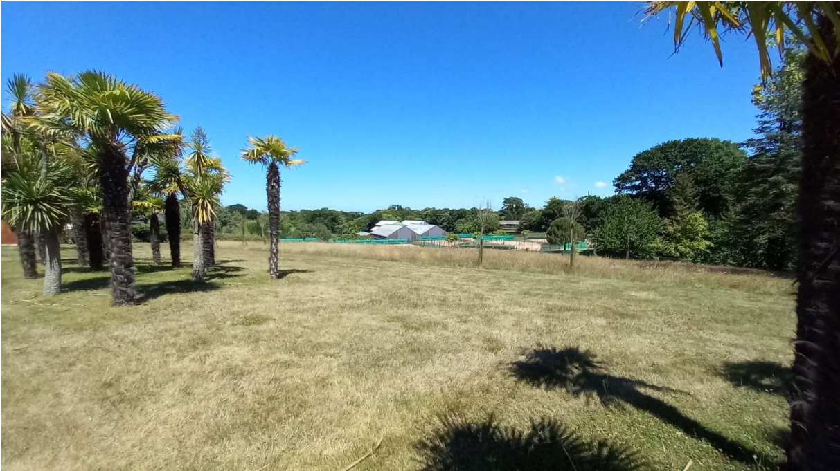
Cône de vue n°7 Boulevard de la Libération (la perspective visuelle sur le manoir de Port Breton a été bouchée par la croissance des arbres)