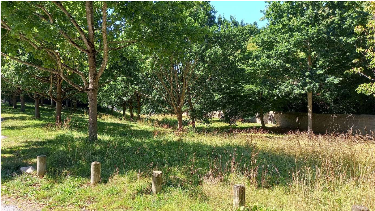
Cône de vue n°8 – Avenue de la Vicomté (en direction de l'anse de Port Nican). La perspective visuelle a été bouchée par la plantation d'arbres au début des années 2000.