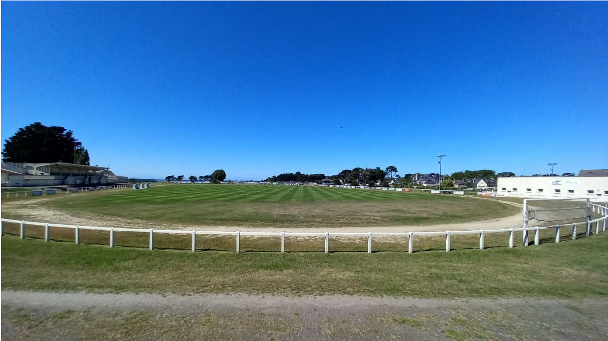
Cône de Vue n°1 - Rue de Starnberg